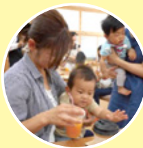
子どもの居場所づくり (食事提供と学習支援)

さらに、「子どもの貧困」対策として学習支援や食事支援、居場所づくりを行い、子どもたちの孤立を防いでいます。