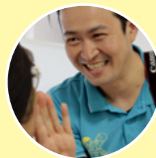
被災地で活動する支援スタッフ