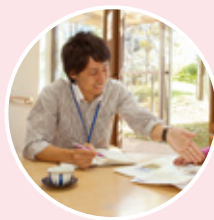
生活困窮者自立支援