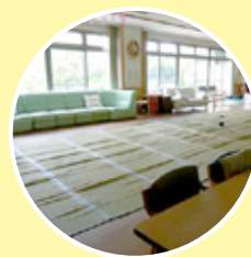
福祉避難所として、地域で 特別に支援を必要とする人々を 守ります