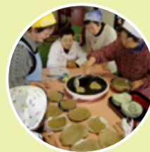
空き家を交流拠点に