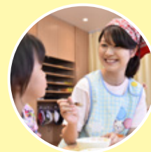
子育てを支える 保育所の経営