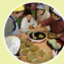
空き家を交流拠点に